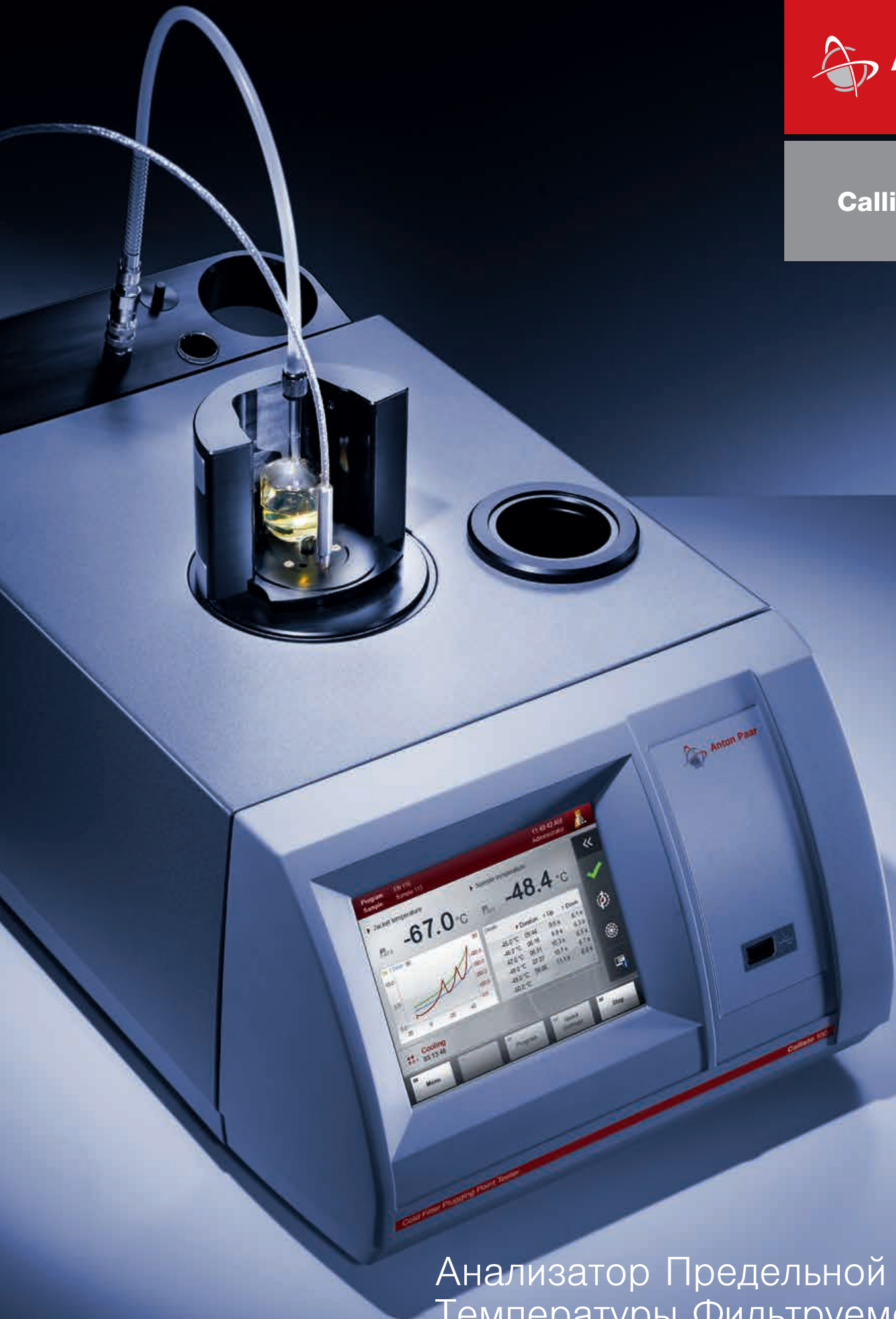
Анализатор Предельной Температуры Фильтруемости